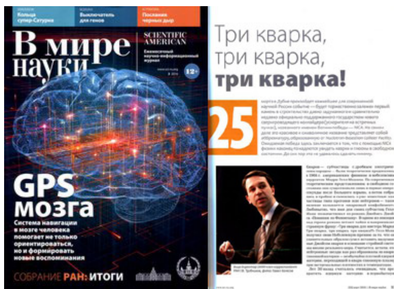
Рис 1.2 Научный журнал «В мире науки»