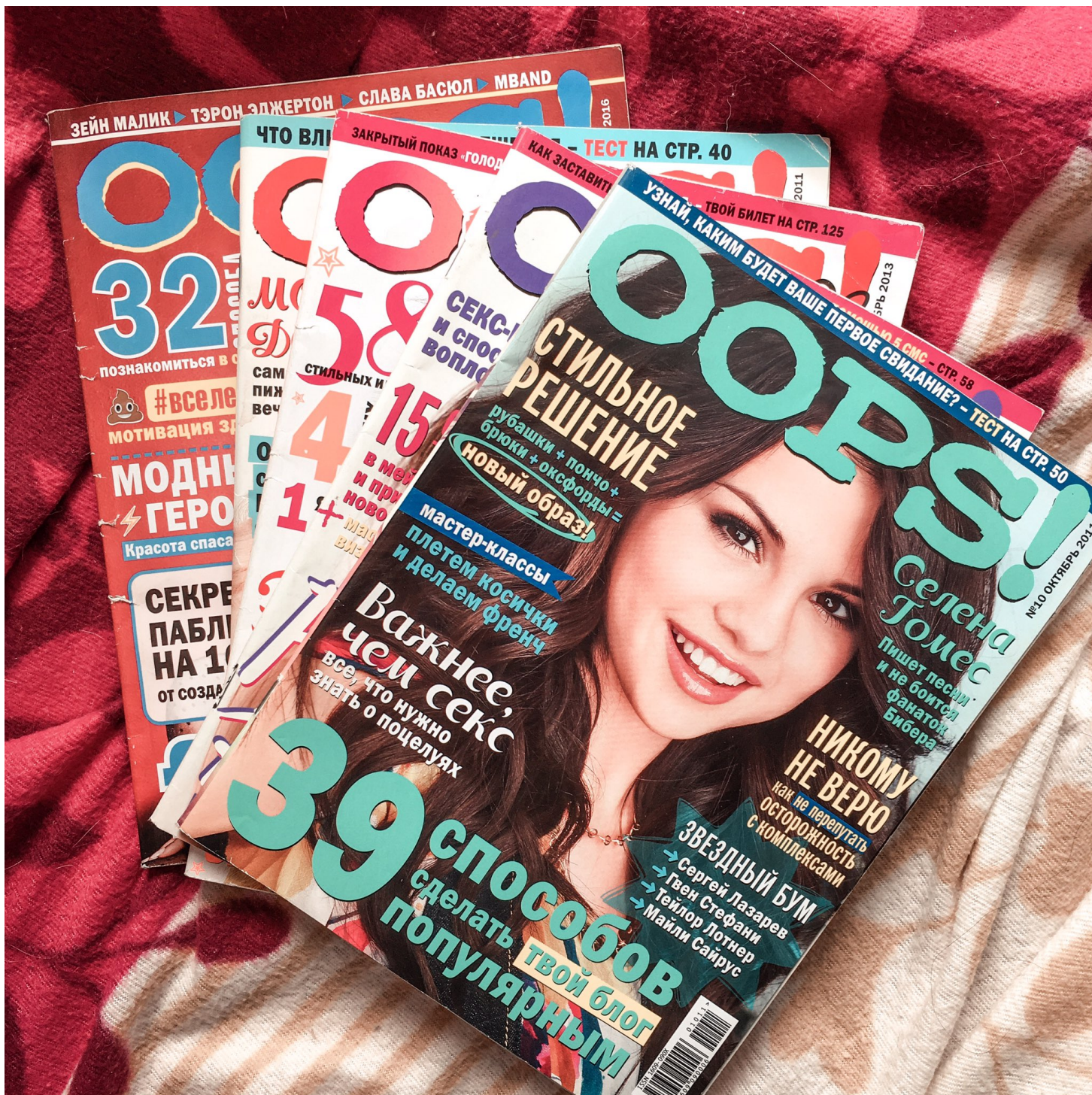
Рис 1.3 Популярный журнал «OOPS!»