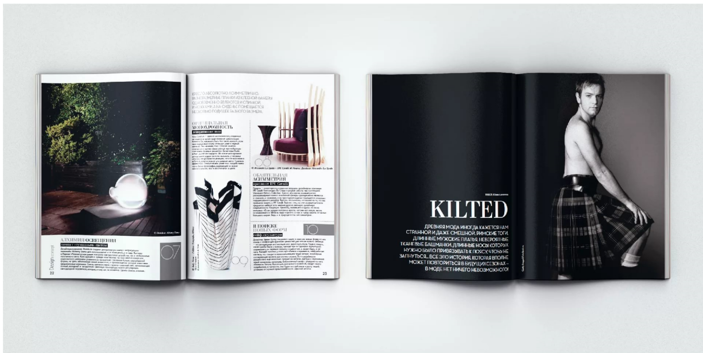
Рис 2.2 Развороты журнала «Design and Style»

Наиболее объемной частью в журнале являются внутренние полосы. В полиграфии полосой называется страница с размещенной на ней информацией. Их вид может быть абсолютно разнообразным, и зависит от верстки страницы. Хотя полосы одной и той же рубрики желательно оформлять в едином стиле, а также выдерживать его из номера в номер. Рубрикой называется постоянный тематический раздел в журнале. Оформление рубрик является важной задачей, они также создают эффект узнаваемости журнала и помогают постоянным читателям лучше ориентироваться в номере. Как отдельный вид стоит выделить рекламные полосы, очень распространенные и занимающие большую часть в коммерческих журналах, основными их критериями служат привлекательность и яркость, хотя реклама может быть очень разнообразной.