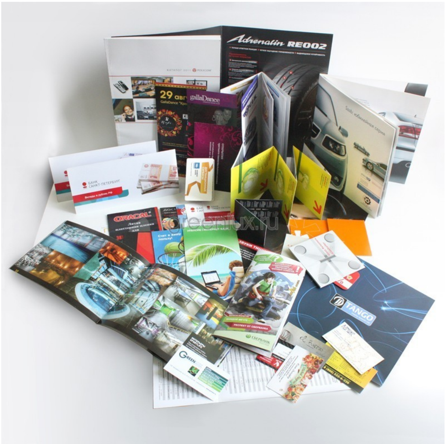
Рис 1.1 Полиграфическая продукция

Полиграфия - область, отрасль промышленности, совокупность технических средств и технологических приемов, используемых для тиражирования (репродуцирования) оригинала, прошедшего редакционную подготовку